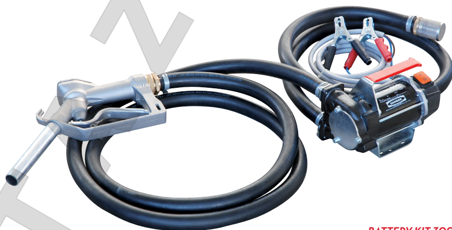
BATTERY KIT 3000