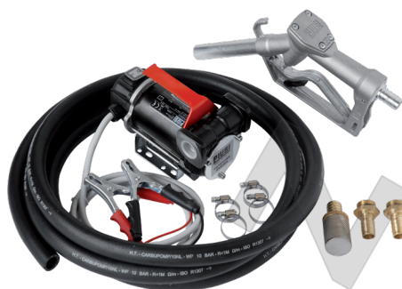
BATTERY KIT 3000 INLINE