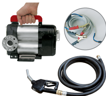
BATTERY KIT BI-PUMP