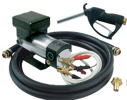
BATTERY KIT OIL