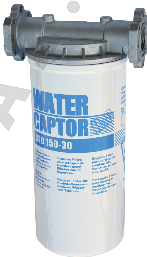
WATER CAPTOR 150 L/MIN