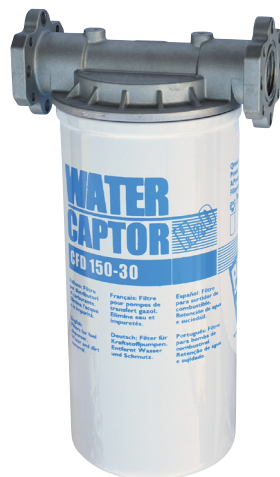
WATER CAPTOR 150 L/MIN CON ASSORBIMENTO ACQUA