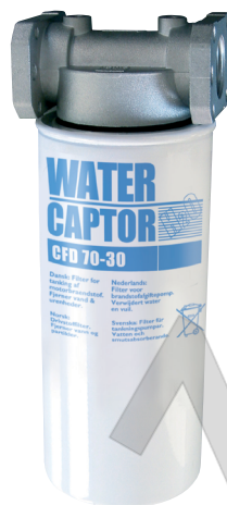
WATER CAPTOR 70 L/MIN CON ASSORBIMENTO ACQUA