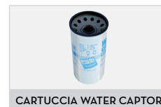
CARTUCCIA WATER CAPTOR