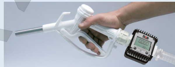
Manual nozzle with K24