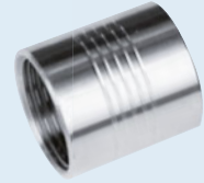
One socket included