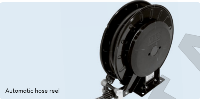
Automatic hose reel