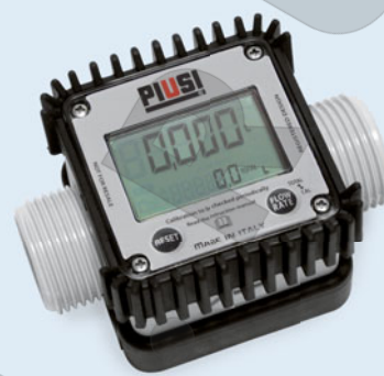
K24 turbine digital meter