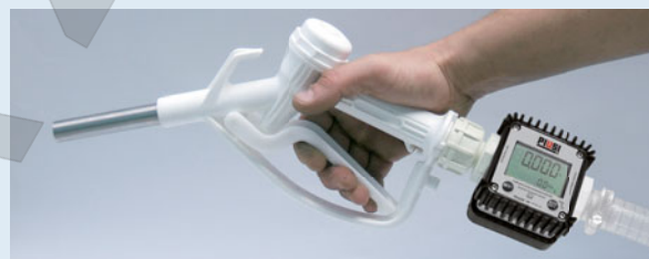
Manual nozzle with K24