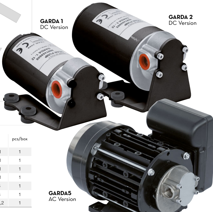
GARDA5 AC Version