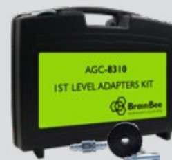
КОМПЛЕКТ АДАПТЕРА УРОВНЯ 1 AGC-8310