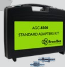
СТАНДАРТНЫЙ КОМПЛЕКТ АДАПТЕРА AGC-8300

Правильный адаптер отображается на дисплее станции, поэтому спокойствие за правильный выбор гарантировано. Опциональная база данных предлагается для более широкого охвата всех возможных областей применения.