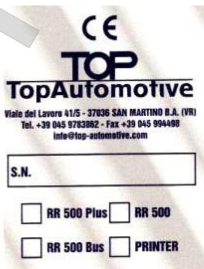
Рис. 1 – Идентификационная табличка

Устройство идентифицируется табличкой, указывающей модель, год выпуска и серийный номер. Табличка находится на боковой стороне устройства (рис.1).