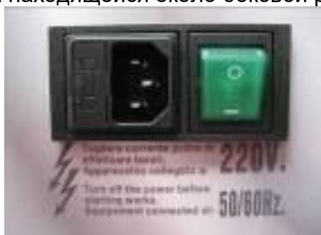
Рис. 5 – Разъем питающего кабеля

Перед включением устройства удостовериться, что напряжение сети совпадает с указанным на находящейся около боковой розетки табличке.