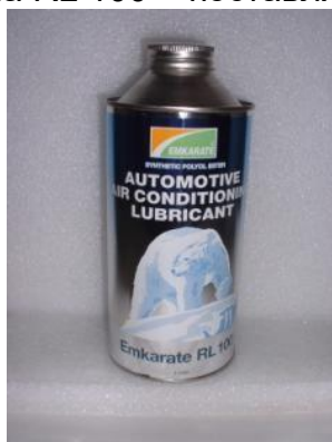
Рис. 7 - Синтетическое масло для охлаждающих систем R134 21CR (поставляемое по заказу)