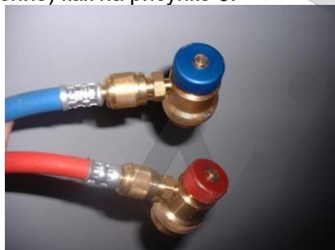
Рис. 6 – Соединение шлангов и разъемов