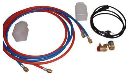
Рис. 2 - Комплектация