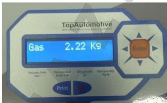
Рис. 4 – Внешний вид дисплея