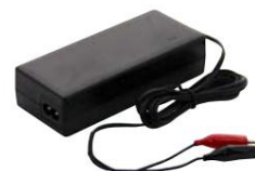
Аккумуляторные версии с зарядным устройством