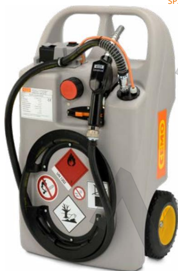
Дизельная тележка 60л с электронасосом CENTRI SP30 и аккумулятор