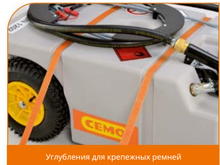
Углубления для крепежных ремней

Встроенный держатель сопла с запираемой защелкой.