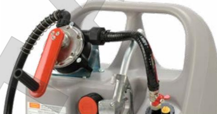
Дизельная тележка 60л с кривошипным насосом