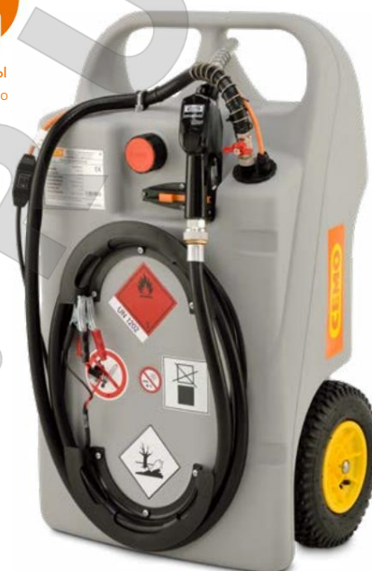
Дизельная тележка 100л с Электронасосы CENTRI SP30