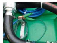
Cavo di messa a terra con pinza. Grounding cable with clamp.